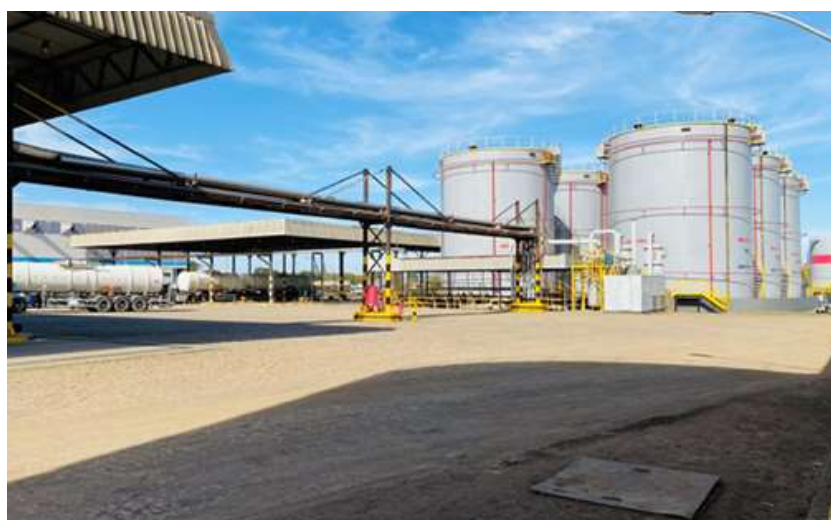
Ponto de Distribuição de Paulínia/SP