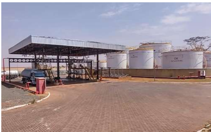
Ponto de Distribuição de São José do Rio Preto/SP

14. Em razão do sucesso e crescimento exponencial de suas operações, foram desenvolvidos novos pontos de distribuição ao longo de todo o estado, com a criação de bases nas cidades de Guarulhos, São José do Rio Preto, Bauru, Arujá, Ribeirão Preto, Osasco e Paulínia, as quais contaram com investimentos vultosos, a fim de aumentar a capacidade de armazenamento e movimentação na região, bem como de suprir as necessidades de seus diversos clientes: