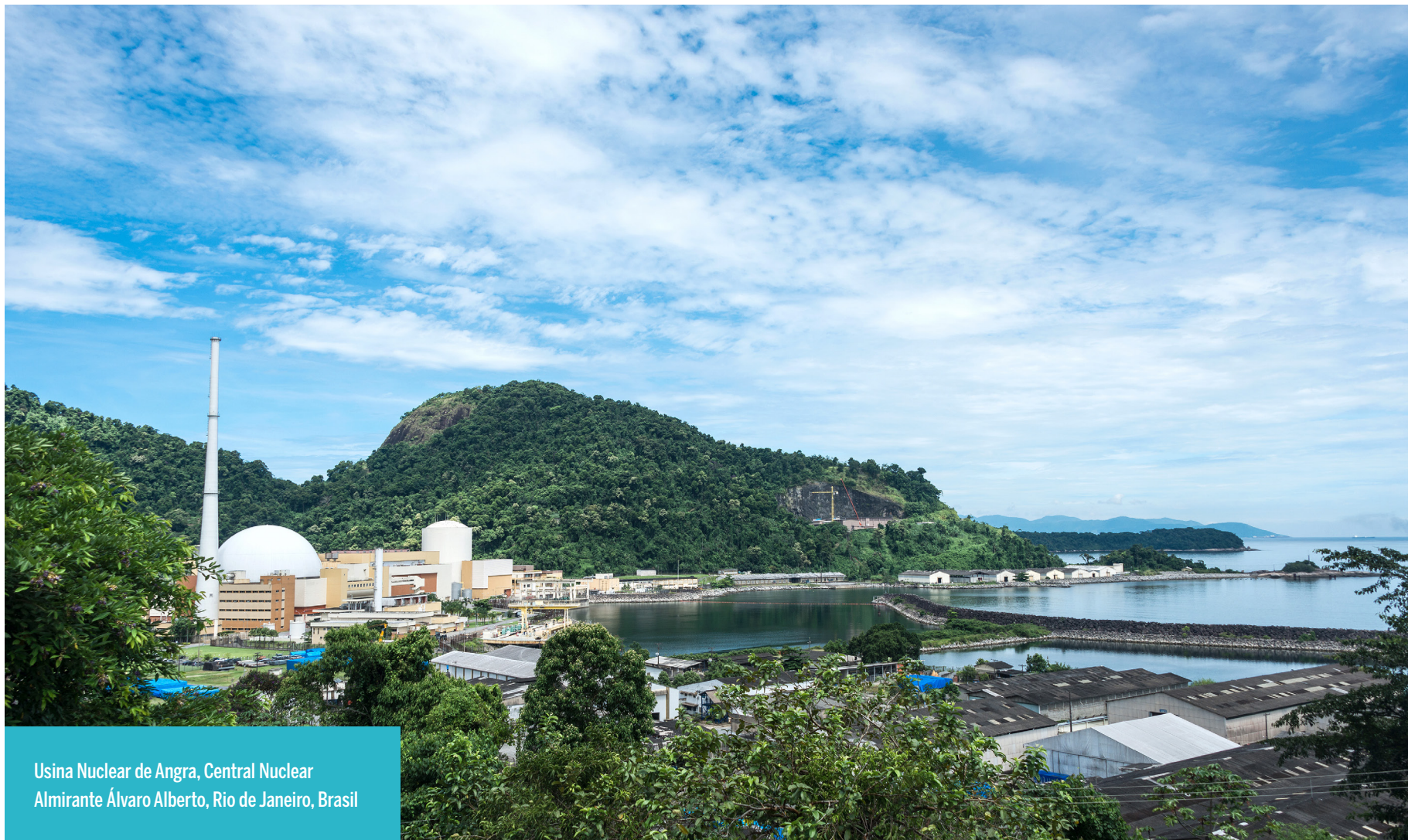
Usina Nuclear de Angra, Central Nuclear Almirante Álvaro Alberto, Rio de Janeiro, Brasil

que toca a Itacuruba, também a atenção para o sofrimento da população relatado no documentário citado e para o risco de que novo trauma esteja a caminho.