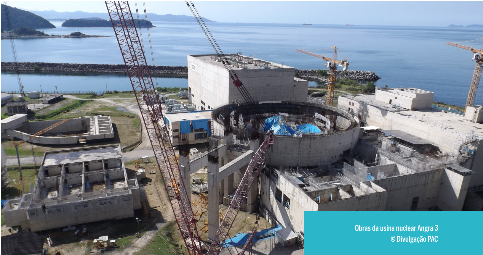
Obras da usina nuclear Angra 3

No dia 21 de março de 2011, dez dias após o terremoto de nove graus na escala Richter seguido de tsunamis com ondas de até 15 metros que atingiu o complexo nuclear de Fukushima, no Japão, provocando o derretimento de três reatores e a necessidade de remoção, mantida até hoje, de mais de 100 mil pessoas, o físico José Goldemberg, 91, entrevistado pela revista Exame, afirmou: